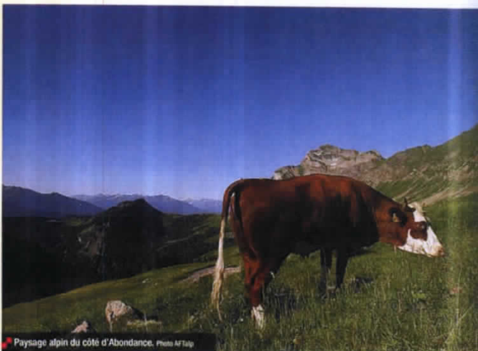
Paysage alpin du côté d'Abondance.

Profitez de l'incroyable diversité des bières de Savoie, de Haute-Savoie, de l'Isère et des Hautes-Alpes pour organiser une soirée dégustation avec les magnifiques fromages de ces terroirs. Voici quatre services « clés en main » qui offre des accords basés sur l'équilibre et sur les contrastes. Un mariage réussi est celui où vous décèlerez une troisième saveur, une troisième texture, qui vous procurera beaucoup de plaisir. Commencez avec une petite bouchée de fromage, puis prenez une gorgée de bière pour apprécier les combinaisons de textures et de saveurs.