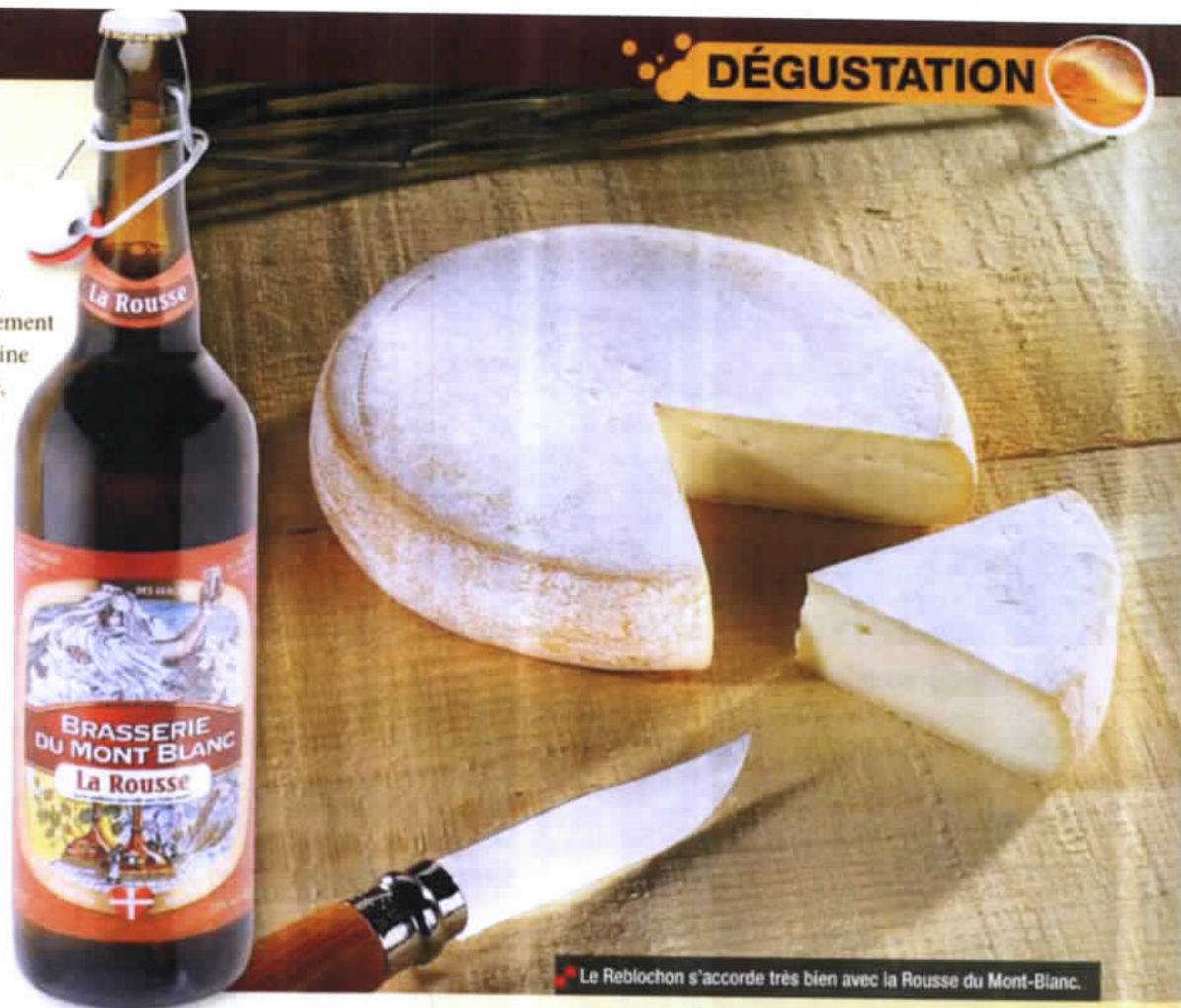
Le Reblochon s'accorde très bien avec la Rousse du Mont-Blanc.

Sacrée « meilleure bière du monde » par le World Beer Awards, après la médaille d'or au CGA cette année, cette rousse-là a de quoi satisfaire les palais les plus exigeants.